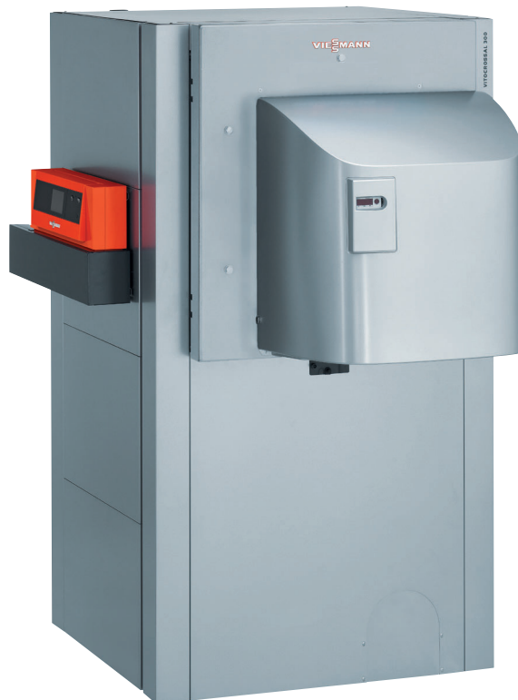
Vitocrossal 300 mit einer Nenn-Wärmeleistung von 400 bis 630 kW

Bewährter Gas-Brennwertkessel mit MatriX-Zylinderbrenner, Inox-Crossal-Wärmetauscherfläche und einfach zu bedienender Regelung Vitotronic