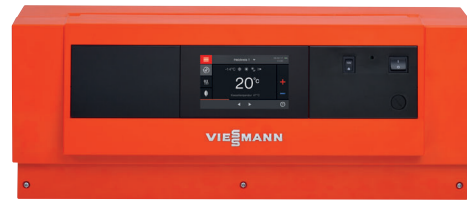
Vitotronic Regelung mit Farb-Touch-Display