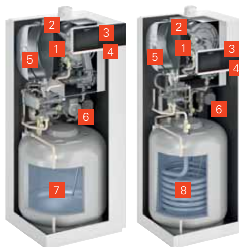
Vitodens 222-F mit emailliertem Ladespeicher (Typ B2TE)