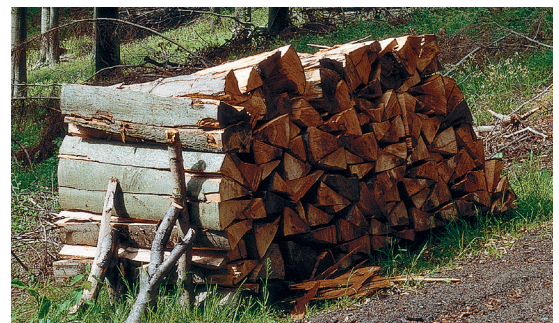
Heizen mit Holz – der natürlichste Brennstoff der Welt

Die Füllraumbreite beträgt 1080 Millimeter und bietet eine komfortable Befüllung auch mit Meterscheiten.