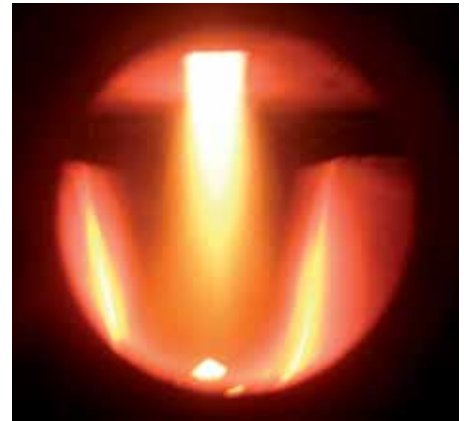
A speciális kerámia tüztér működés közben

A felhevített fahasábokból kilépő fagáz magas hőmérsékleten ég, ezért a tüztér megfelelő ipari kerámiából készült. Az elégetéshez a töltőtérből ventilátor szívja be a felhevített fagázt. A töltőtér szívott, így utántöltés során nem tud füstgáz a felállítási helyiségbe kerülni. Az égés magas, akár 85% feletti tüzelés-technikai hatásfokkal megy végbe.